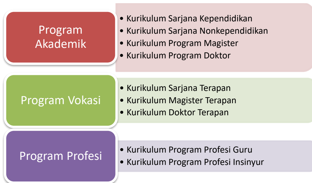
Gambar 2. Model Kurikulum UNY

Kurikulum Universitas Negeri Yogyakarta terdiri dari program akademik, program vokasi, dan program profesi. Model kurikulum dijelaskan pada Gambar 2.